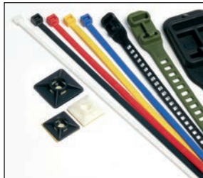
Kabelbinder & Zubehör