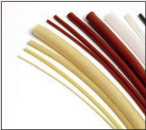
Silikon- & Glasseidenschlauch